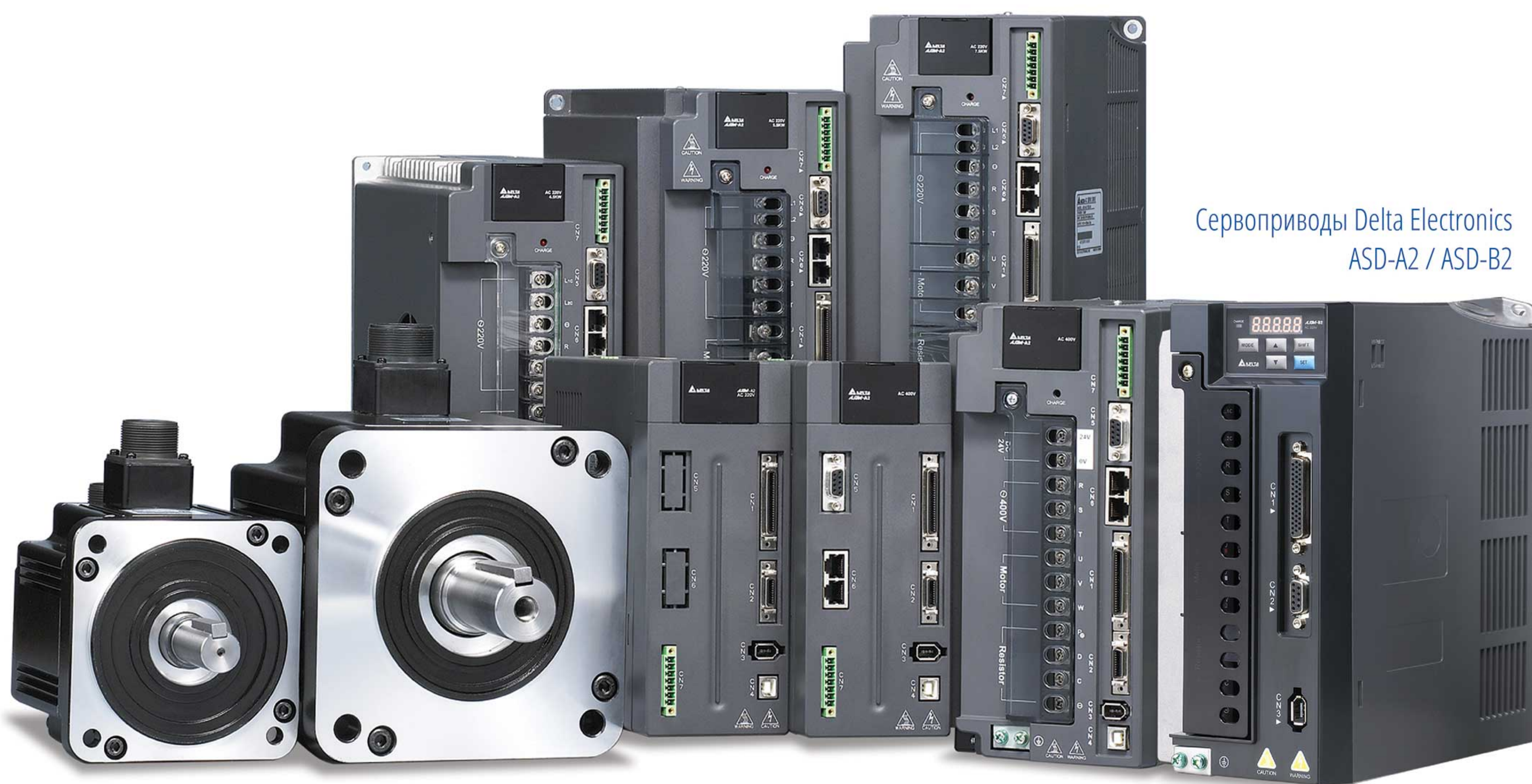
Сервоприводы Delta Electronics ASD-A2 / ASD-B2